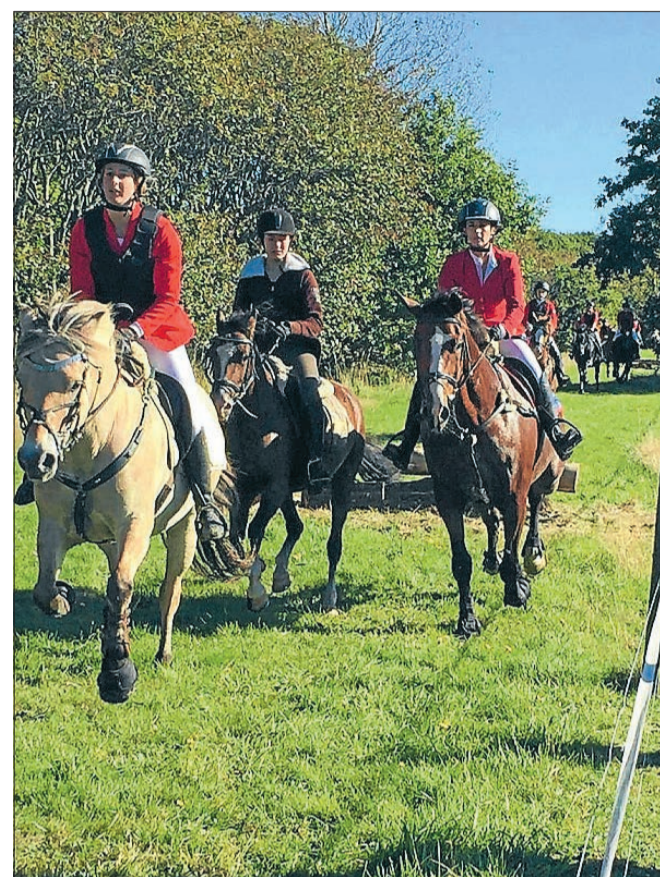
24 ekvipager tog del i jagtridningen.

Kinnerup Heste-Artikler bidrog til arrangementet som præmiesponsor.