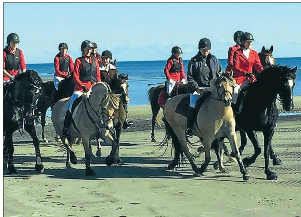
Jagten løb af stablen i det naturskønne område omkring Hals.